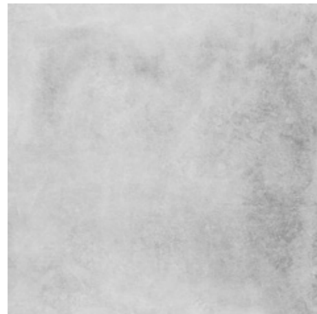
Y-ONE 331 zement | cement | ciment 60 x 60 cm