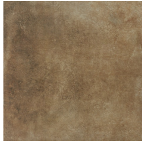
Y-ONE 338 terra | terra | terre 60 x 60 cm