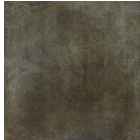
Y-ONE 337 tabak | tobacco | tabac 60 x 60 cm