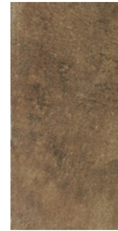
Y-ONE 938 terra | terra | terre 30 x 60 cm