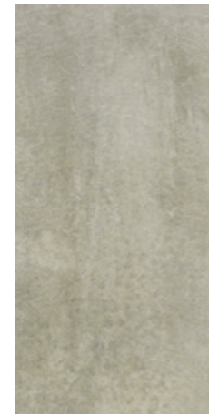
Y-ONE 932 sand | sand | sable 30 x 60 cm