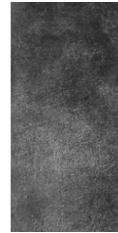
Y-ONE 935 graphit | graphite | graphite 30 x 60 cm