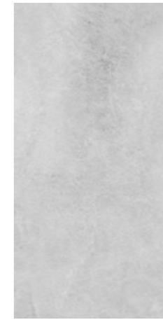
Y-ONE 931 zement | cement | ciment 30 x 60 cm