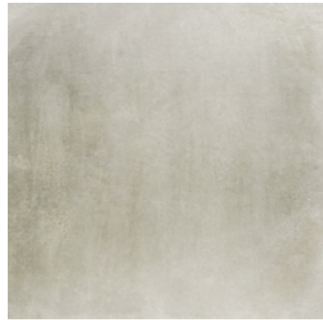
Y-ONE 332 sand | sand | sable 60 x 60 cm