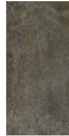
Y-ONE 937 tabak | tobacco | tabac 30 x 60 cm