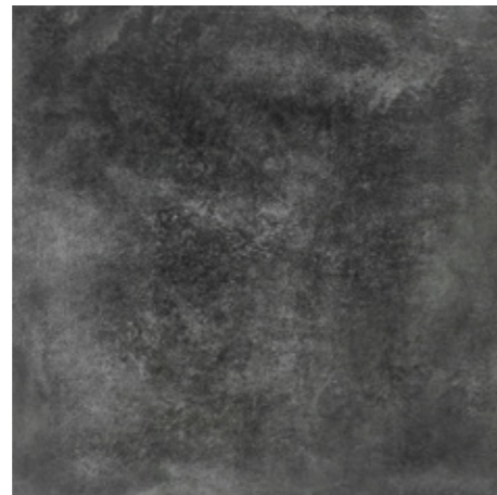
Y-ONE 335 graphit | graphite | graphite 60 x 60 cm